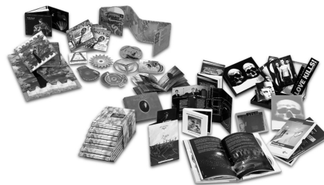
12 cm CD/DVD Verpackungen

Bestellung bitte durch Ankreuzen der Trayfarbe sowie Ausfüllen der Bestellmenge bestätigen.