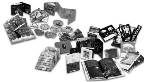
12 cm CD/DVD Verpackungen

Bestellung bitte durch Ankreuzen der Trayfarbe sowie Ausfüllen der Bestellmenge bestätigen.